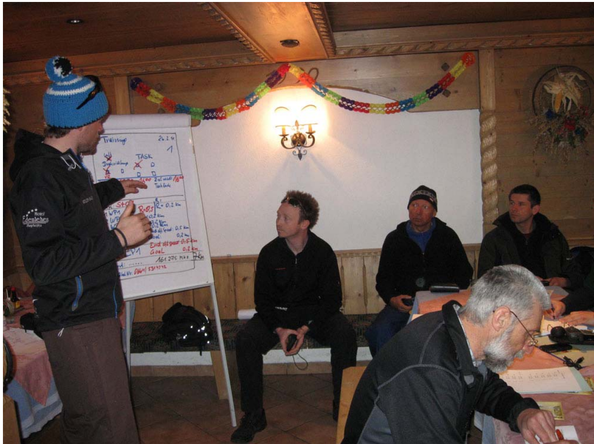
Auf dem taskboard steht die Flugaufgabe mit allen wichtigen Informationen